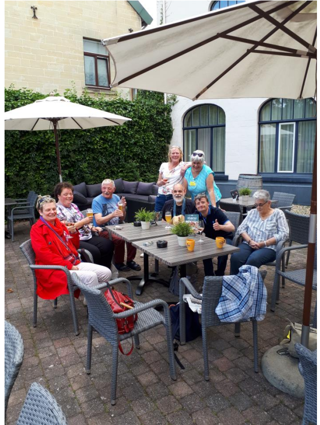
genietend van een rosetje op het terras